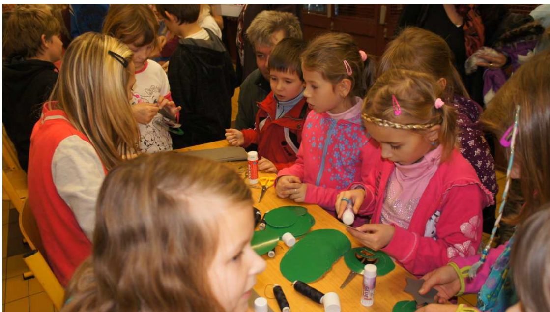
Vánoční dílna pro MŠ

Další formou spolupráce s rodiči je sponzorování třídních akcí (výlety, exkurze, besídky,..).