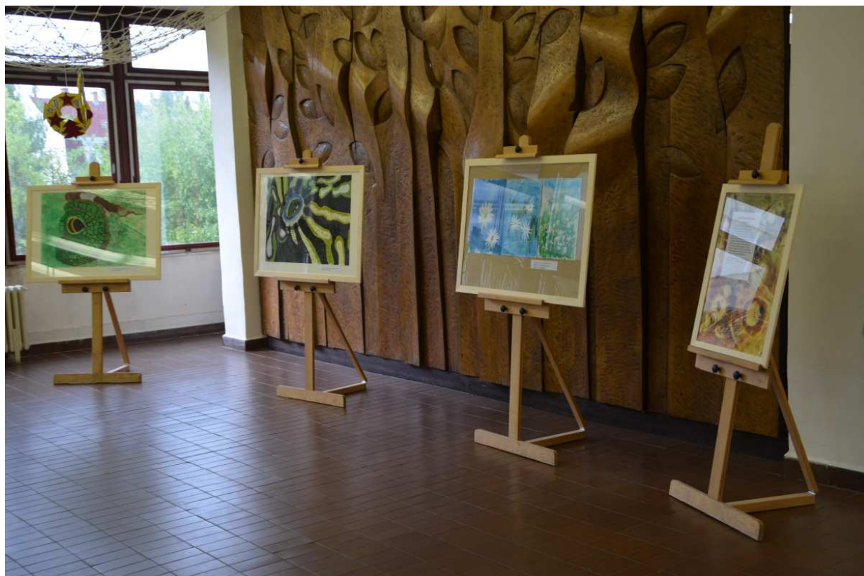
Vernisáž k 30 letům školy.

Spolu s vyučující výtvarné výchovy se žáci školy zapojili do projektu Muzejní noc, kde mohli prezentovat své práce a reprezentovat školy v širším měřítku.