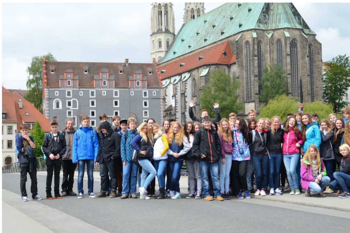
Exkurze do Německa.

Žáci 5. a 7. ročníků se také zúčastnili Dne s Městskou Policií, kde pro ně byla připravena stanoviště, na kterých plnili různé úkoly z oblastí první pomoci, orientace v prostoru, dopravní výchovy a jiné. Ve školním roce 2012/2013 jsme rozšířili spolupráci s PČR a využili jsme jimi nabízené preventivní programy. V tomto školním roce nebyly tyto programy využity z důvodu široké nabídky společnosti Maják s. r. o. Následně pak žáci 7. ročníků prošli besedou s pracovníky MP v Jablonci nad Nisou. Tématem besedy bylo pochopení náplně práce strážníků MP a připomenutí si základů pravidel silničního provozu.