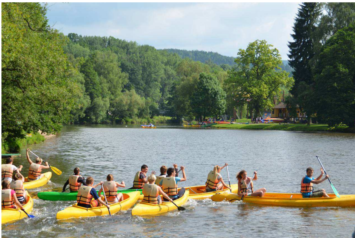
„Soustředění“ na Malé skále.

reedukace poruch učení k zásadní změně, reedukace byla realizována třídními učitelkami, což se velmi osvědčilo. O žáky s obtížemi komunikačními a řečovými bylo pečováno v logopedickém kroužku.