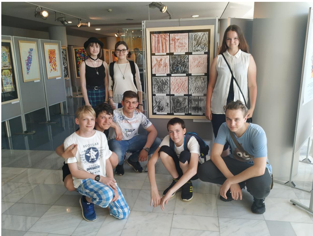
Vernisáž – KÚ LK