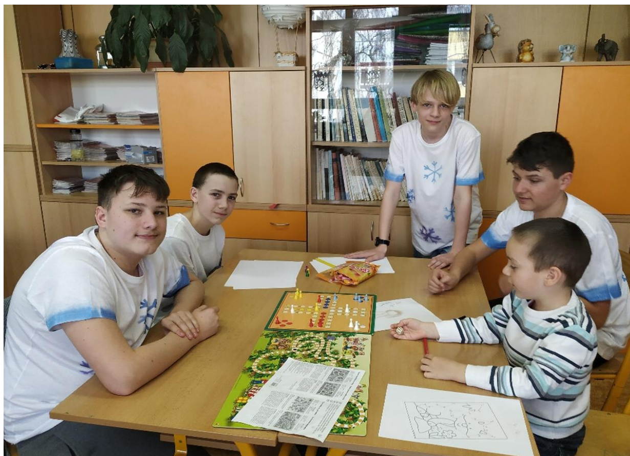
Zápis do 1. tříd

Posuzováno podle zákona č. 563/2004 o pedagogických pracovnících a změně některých zákonů.